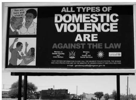
Violência Doméstica: Um Outdoor na Namíbia lembrando às pessoas que a violência com base em gênero é contra a lei.

O que permitiu que essas leis resultassem em mudanças reais foi a natureza altamente descentralizada da governança nas Filipinas. Diferentes unidades do governo, até o nível da barangay (vila), têm sido essenciais no estabelecimento de processos participativos para conscientizar a população sobre o problema da VBG e